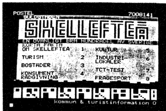
Sökning på Skellefteå