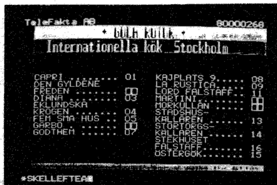
Sökning av internationella kök i Stockholm