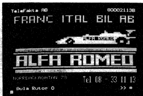
Sökning på bilar

Genom sökning av ord t.ex. "Restauranger" fås en bild med val över länder (f.n. endast skandinavien). Sverige väljs och ännu ett val kommer upp: städer i Sverige. Efter val av stockholm kommer en meny upp över vilken typ av restaurang vi letar efter. Jag väljer internationella kök. En ny bild blir synbar (se. bild 2) härifrån kan jag sedan gå in på de olika restaurangerna och se vad de har för utbud. I framtiden kommer man även att kunna beställa bord osv.